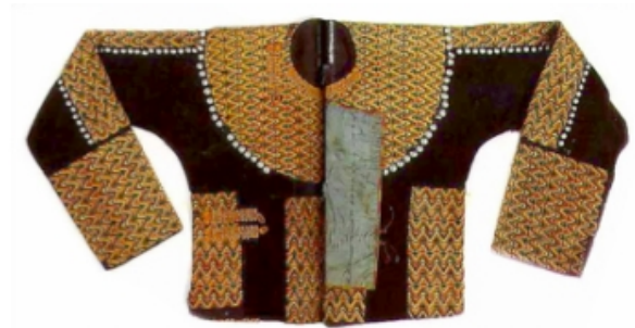
圖 1：臺灣原住民數位博物館 (文獻來源)